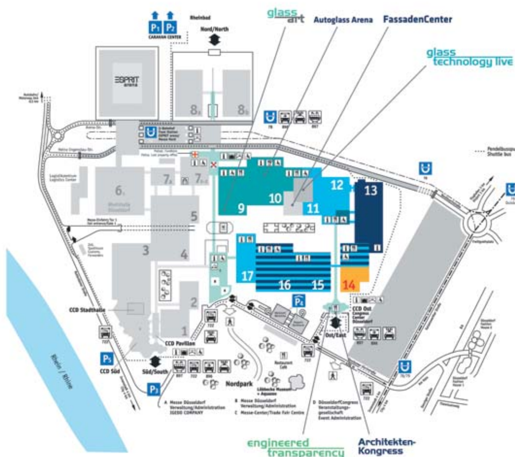
Stand: März 2010 / As of: March 2010 Änderungen vorbehalten / Subject to change

We look forward to welcoming you personally at our booth.